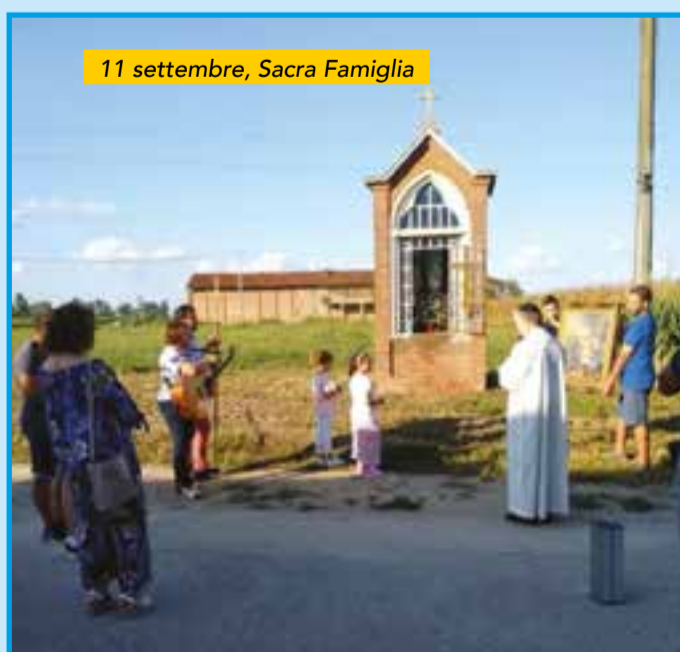
11 settembre, Sacra Famiglia

PARROCCHIE ASSUNZIONE DI MARIA VERGINE E SAN MICHELE SAN LUCA EVANGELISTA