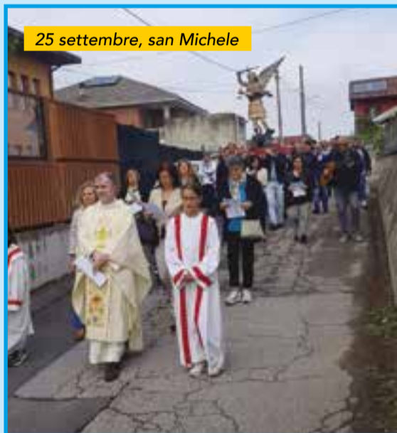
25 settembre, san Michele