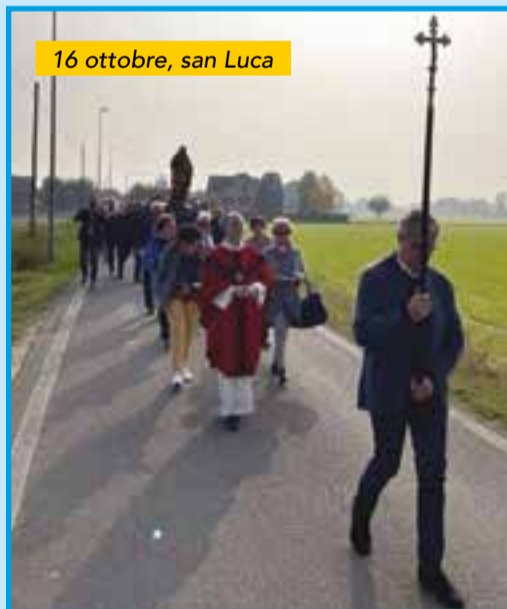
16 ottobre, san Luca