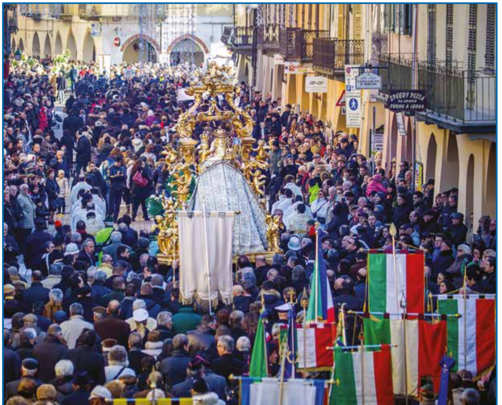
Un'immagine anti Covid della processione dell'Immacolata

Partendo da queste indicazioni, siamo chiamati tutti a un breve esercizio comunitario di ascolto reciproco che ci permette di coltivare i "germogli" di novità sul nostro territorio carmagnolese. Possono essere alcuni momenti di vita cristiana oppure iniziative, anche sperimentali, che ci appaiono più vive, più belle e promettenti.