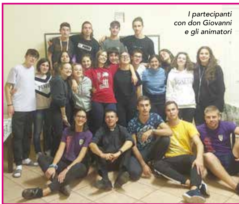
I partecipanti con don Giovanni e gli animatori

È tornata la settimana comunitaria, che per la parrocchia dei Santi Michele e Grato si è svolta da domenica 2 a giovedì 6 ottobre presso la struttura delle suore di Sant'Anna. Nonostante i vari impegni scolastici dei ragazzi e lavorativi degli animatori, è stata un'esperienza che nel suo piccolo ha toccato profondamente il cuore di chi vi ha partecipato.