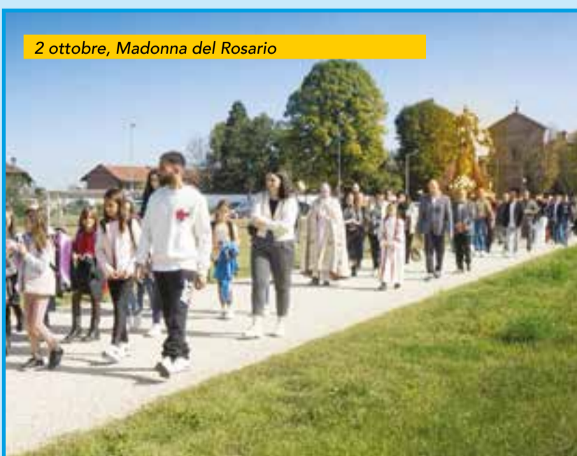
2 ottobre, Madonna del Rosario