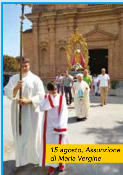
15 agosto, Assunzione di Maria Vergine