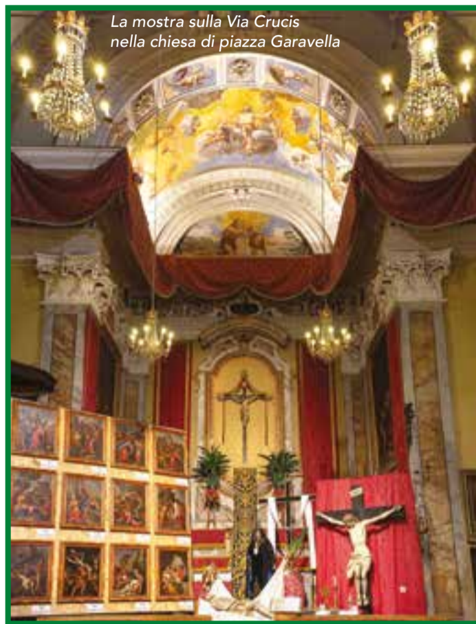
La mostra sulla Via Crucis nella chiesa di piazza Garavella

comincia con queste parole il sonetto scritto da Gio Battista Milanese in occasione del Venerdì Santo del 21 marzo 1845 per il 70° anniversario delle "Solenne Esequie di N.S. Gesù Cristo", come documentato da un interessante libretto che si trova presso l'archivio storico cittadino. La pia pratica di pietà popolare della Via Crucis nacque nel XIII secolo come serie di quattordici "quadri" disposti nello stesso ordine e si diffuse in tutto il mondo, in modo particolare in Spagna. Nella prima metà del XVII secolo poteva essere esposta alla pubblica devozione esclusivamente nelle chiese dei Minori Osservanti e Riformati. Successivamente Clemente XII estese, nel 1731, tale facoltà anche alle