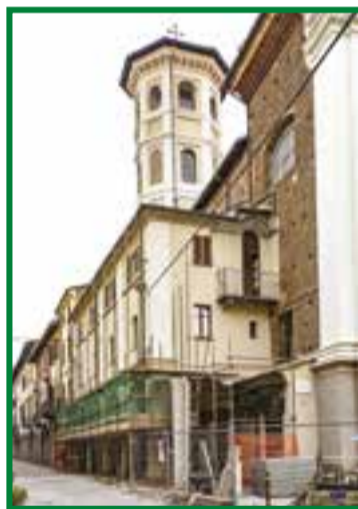
Si smontano i ponteggi, i lavori sono terminati